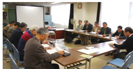
実践セミナーの様子