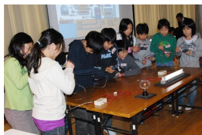
手回し発電キットによる実験

お知らせ！！ 環境教育リーダーの活動の様子(写真、記事など)をお知らせください。 センター便りに掲載したいと考えています。