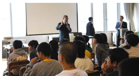
省エネ教室の様子