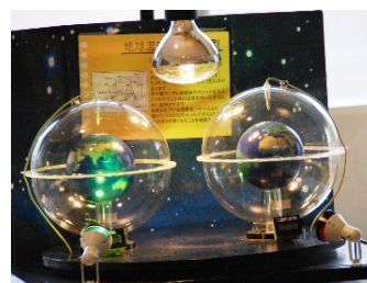
温暖化効果キット

生徒達は模型を使った火力発電のしくみや手回し発電キットによる電気の強さの比較、また大気中のCO 2 濃度による温度上昇を調べました。