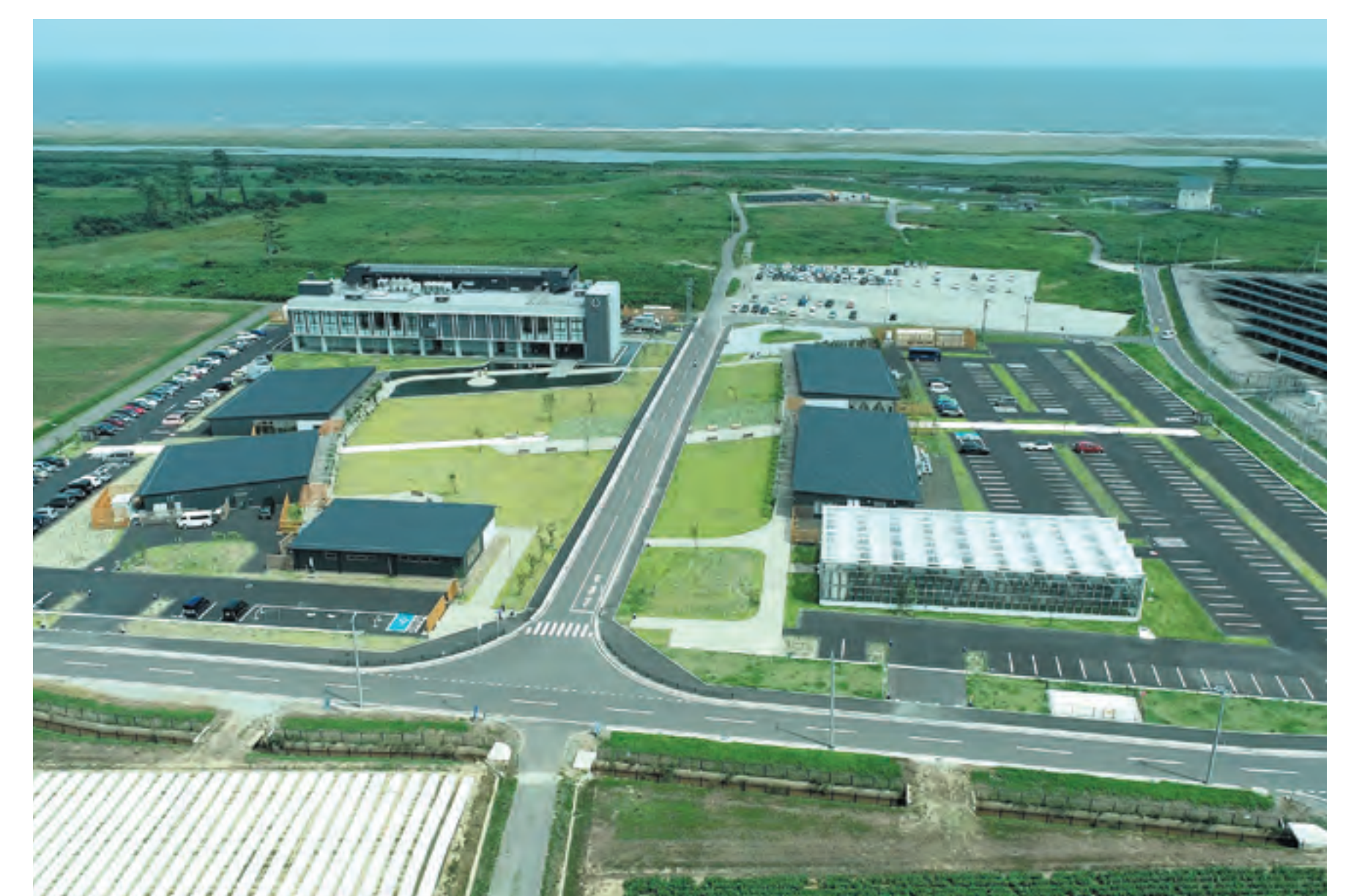
アクアイグニス仙台