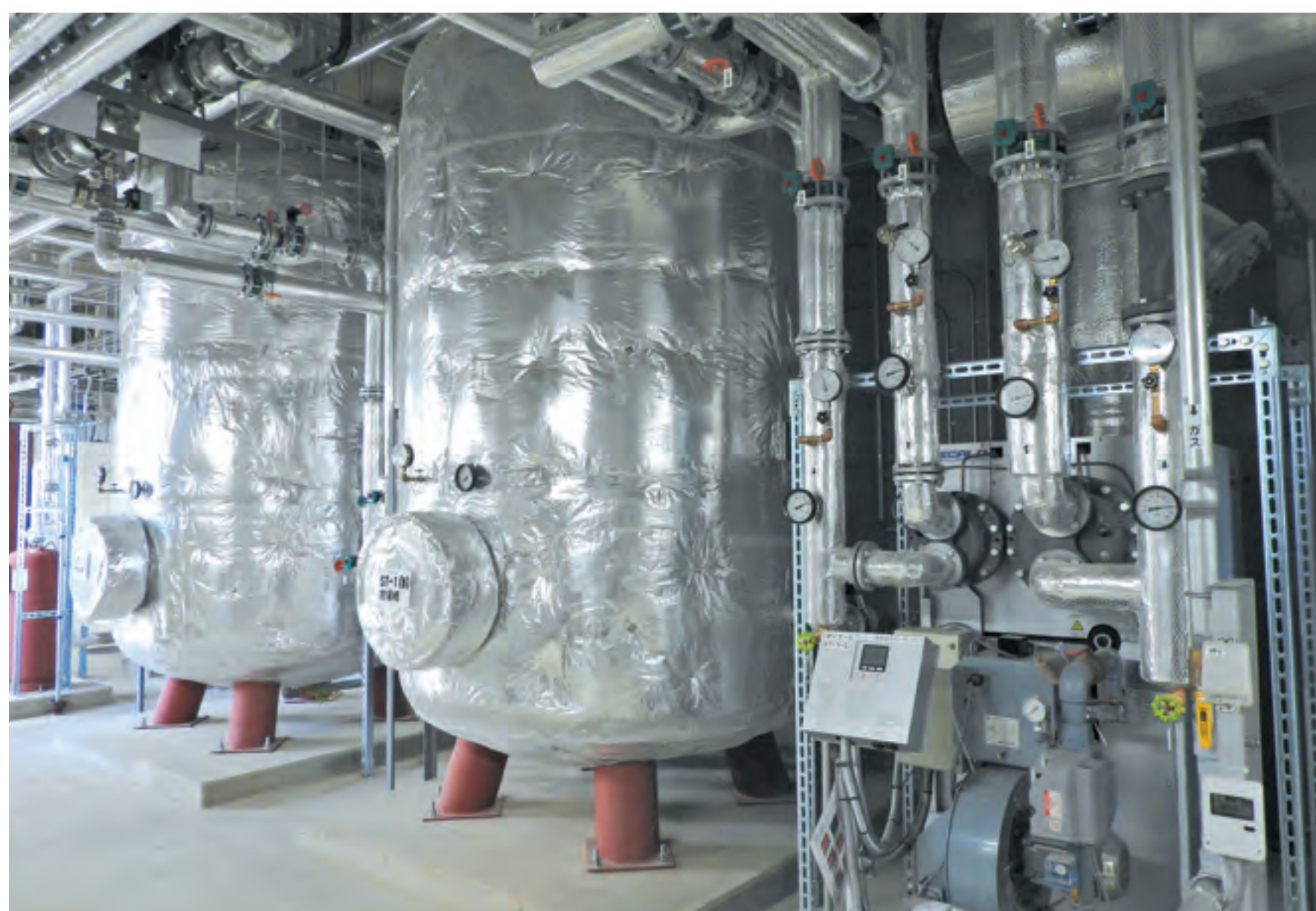
地中熱+下水熱+排ガス熱+排熱湯気を回収、さらに昇温・蓄熱し施設に供給

アクアイグニス仙台に、地産地消型の省エネ設備として「地中熱回収システム」を導入。4種の熱(地中熱、排水熱、排ガス熱、排気熱)を回収し、温泉の加温や施設内の床暖房の熱源として利用、敷地内の農業ハウスにおいて、太陽熱蓄熱システム並びに温泉排熱及び地中熱を活用し、化石燃料を使用しないイチゴ栽培に産学官連携で取組むなど、先導性及び継続性を有している。その他、SDGsの目標達成に向け、店舗で地産地消、フードロス削減等に取り組むほか、高校生向けにSDGsに関するワークショップを開催するなど、普及啓発にも取り組んでおり、多方面への波及性が期待される。