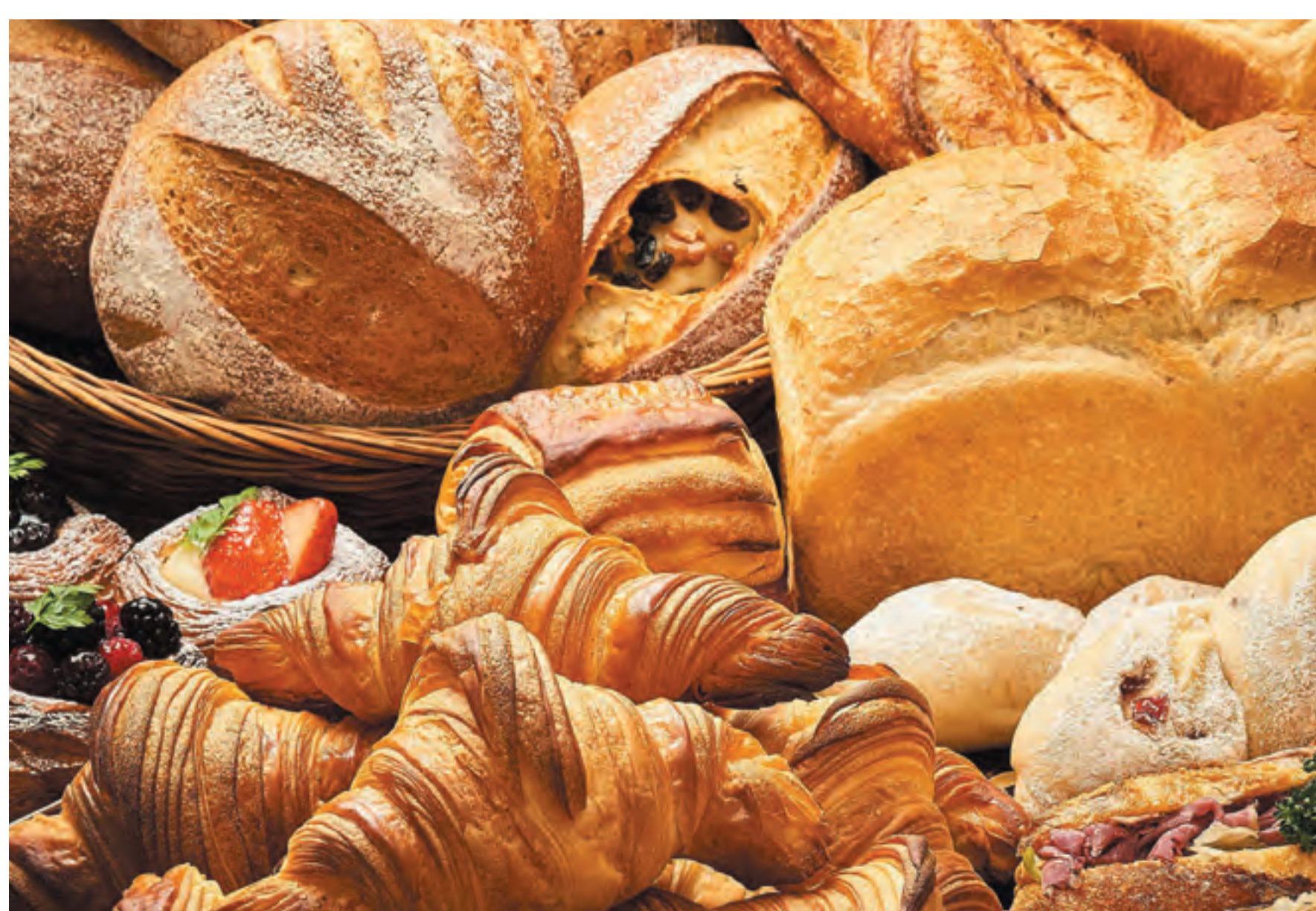
フードロス施策「タベスケ」で、ベーカリー、スイーツの商品を35~50%割引で販売中