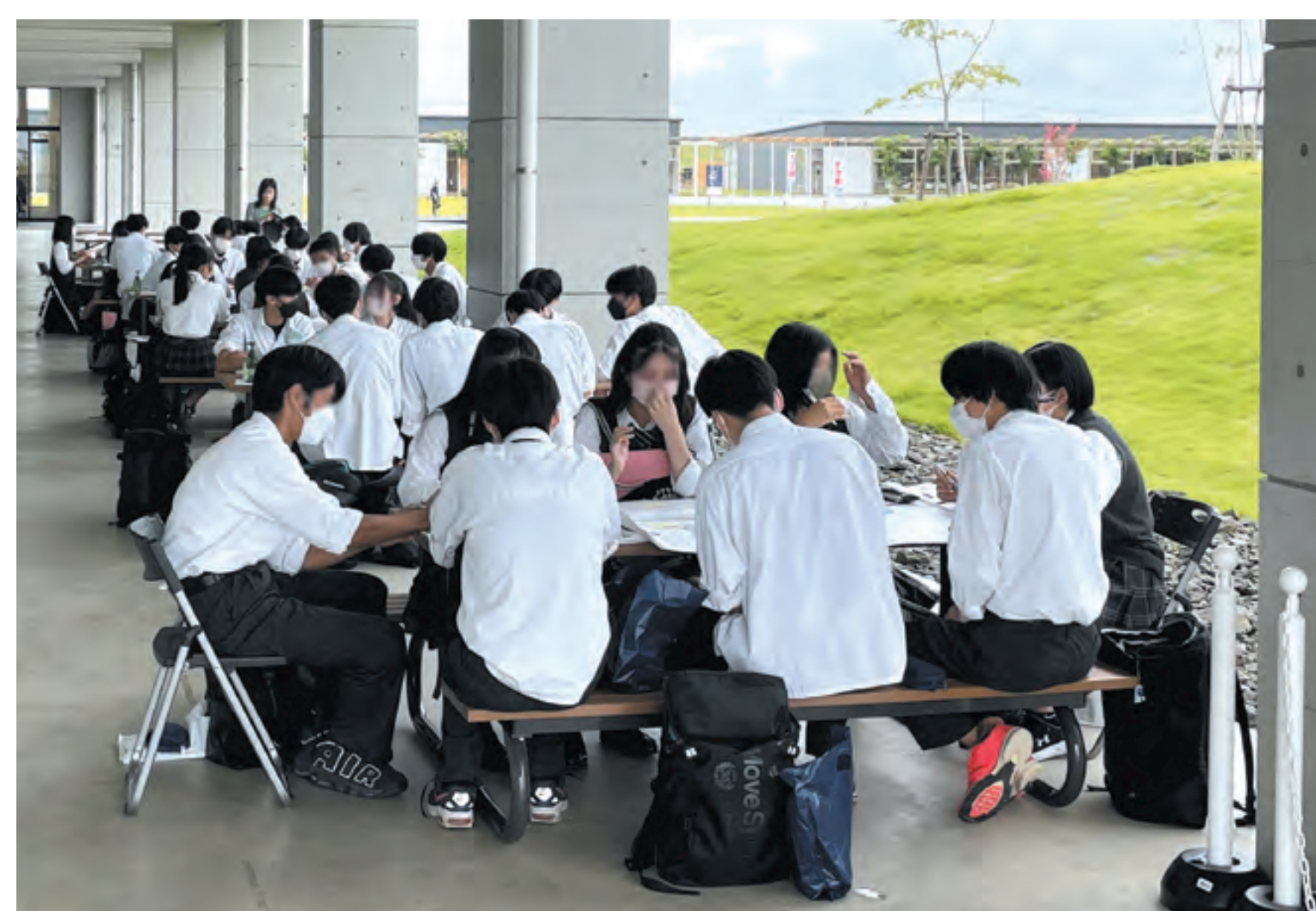
富谷高校2年生がSDGs課題研究ツアーで来館し施設内でワークショップを開催