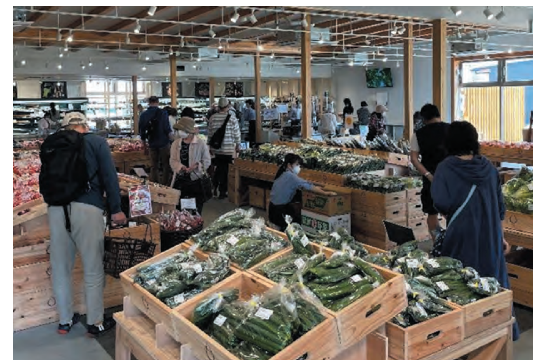
仙台・宮城で採れた食材を揃えたマルシェリアン