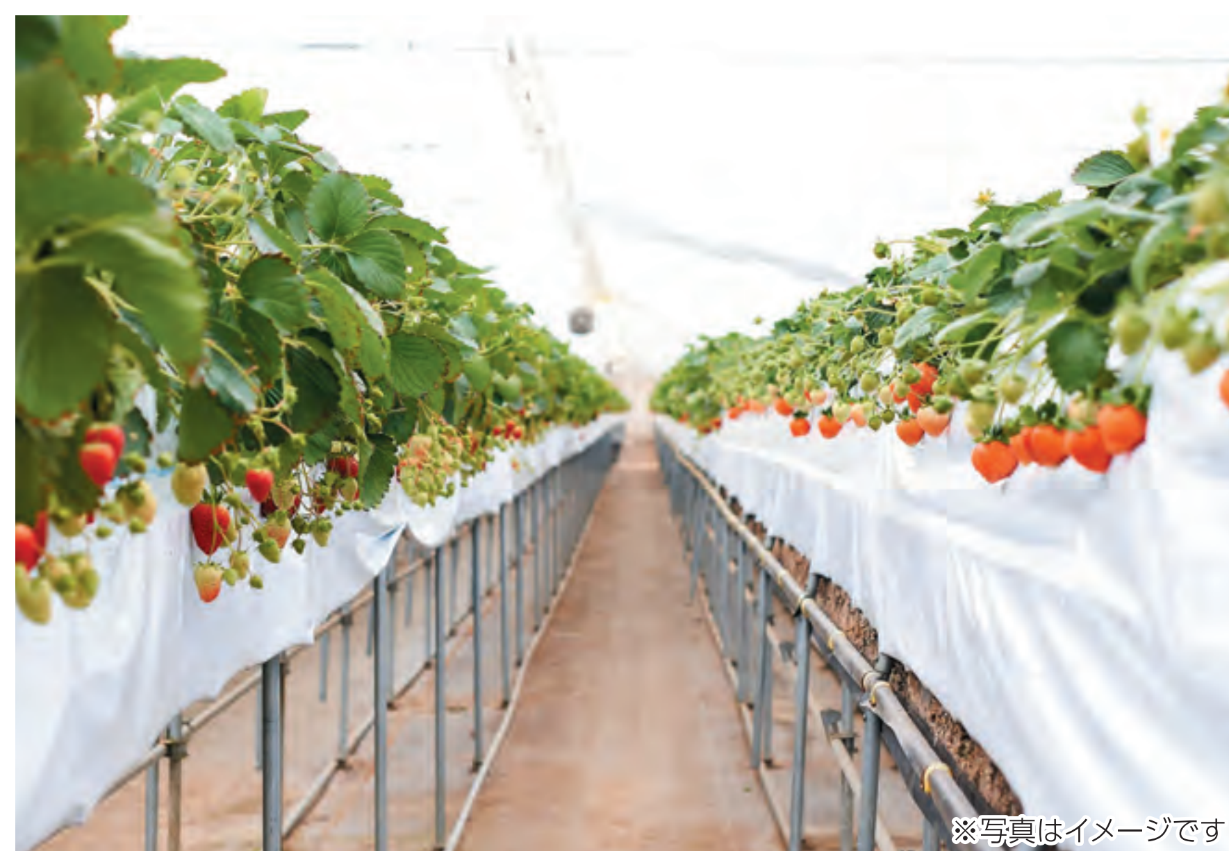
地中熱や回収した排熱、太陽光などを複合的に利用するイチゴ栽培の実証実験に着手