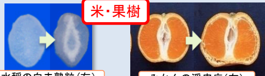
水稻の白未熟粒(右)