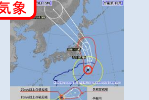
強い台風の発生数等の増加(将来予測)