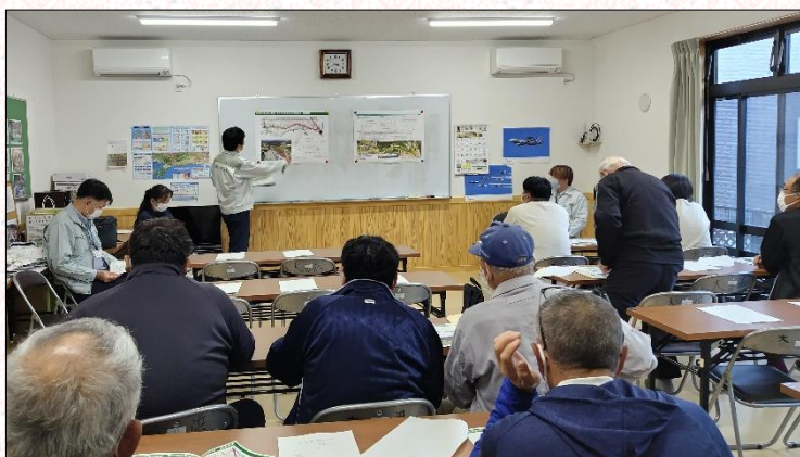
大浜工区説明会開催状況(10月28日(金))