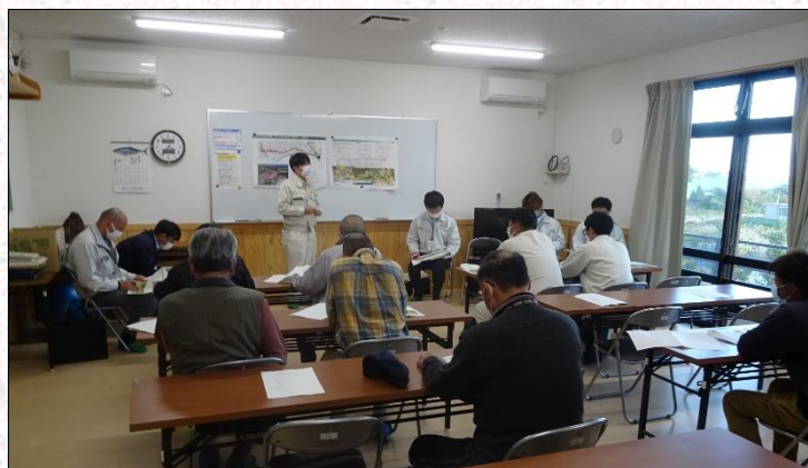
月浜工区説明会開催状況(10月31日(月))