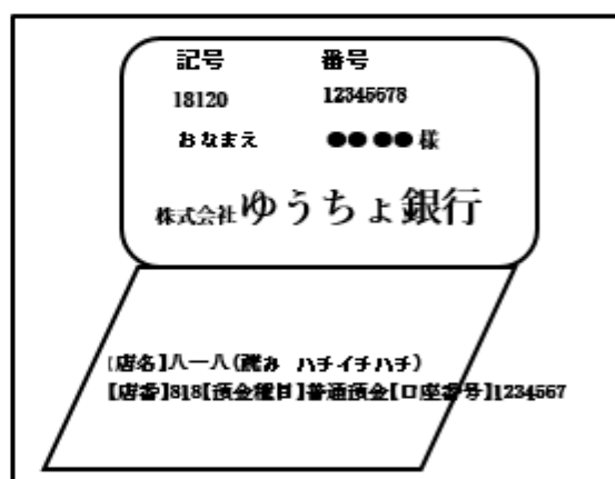
ゆうちょ銀行の場合

※ゆうちょ銀行の場合は表紙ウラの通帳見開き ページ全面のコピーを貼付してください。