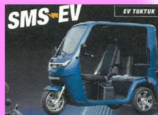
電動トゥクトゥク