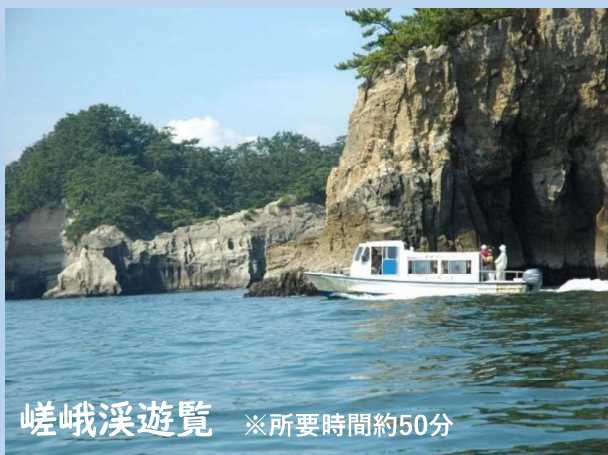
嵯峨溪遊覧 ※所要時間約50分