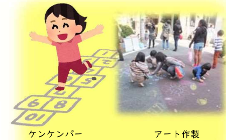
ケンケンパー アート作製