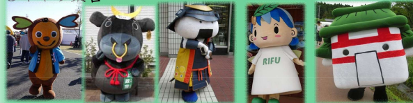
イートくん (東松島市) 牛政宗 (宮城県) むすび丸 (宮城県) リーフちゃん (利府町) たがもん (多賀城市)