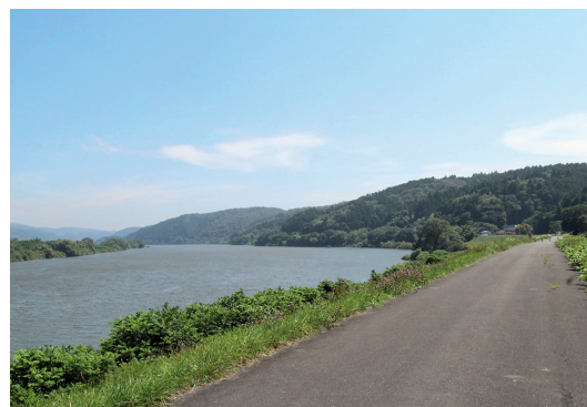
雄大な北上川の河川敷

連続テレビ小説「おかえりモネ」でも描かれた、登米町の北上川河川敷。「みやぎの明治村」の観光拠点である遠山之里から徒歩10分程度。歴史浪漫あふれる登米町の散策の後は、「おかえりモネ」の聖地巡礼を楽しむのがよいかモノ。