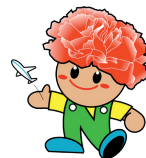
名取市マスコットキャラクター カーナくん