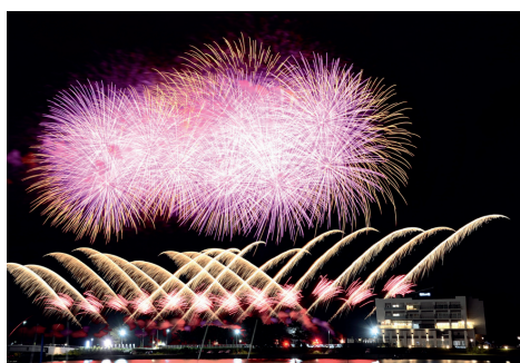
過去最大規模の打ち上げ花火が夜空に輝きました

近年はさらににぎわいを増し、新鮮な魚介類が豊富な「ゆりあげ港朝市」や、飲食店などが集まる「かわまちてらす閑上」、本格的なサイクリングや「おもしろ自転車」が楽しめる「サイクルスポーツセンター」などの観光スポットが多く、活気に満ちあふれています。