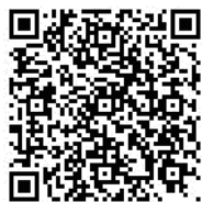
海外募集型企画旅行条件書

※お申込が多数の場合は、ご利用いただけない場合があります。※本ツアーの参加条件等については、東北のかいご協同組合までお問い合わせください。