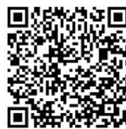
海外募集型企画旅行約款