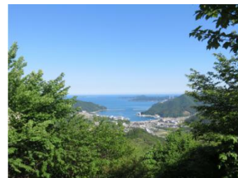
黒森山からの眺望 (女川町)