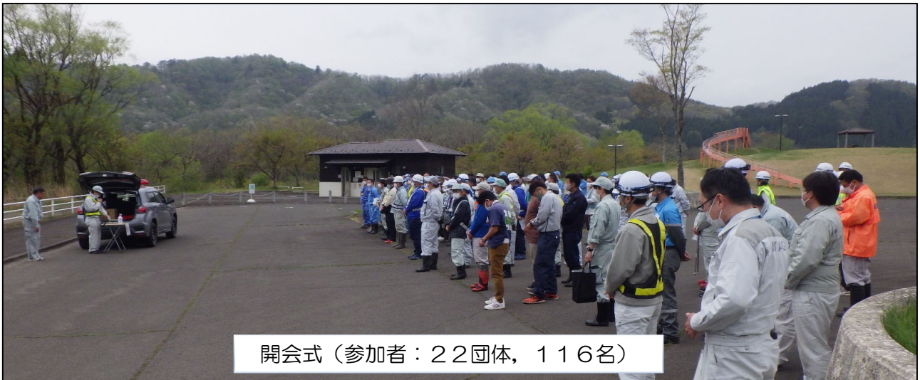
開会式（参加者：22団体，116名）