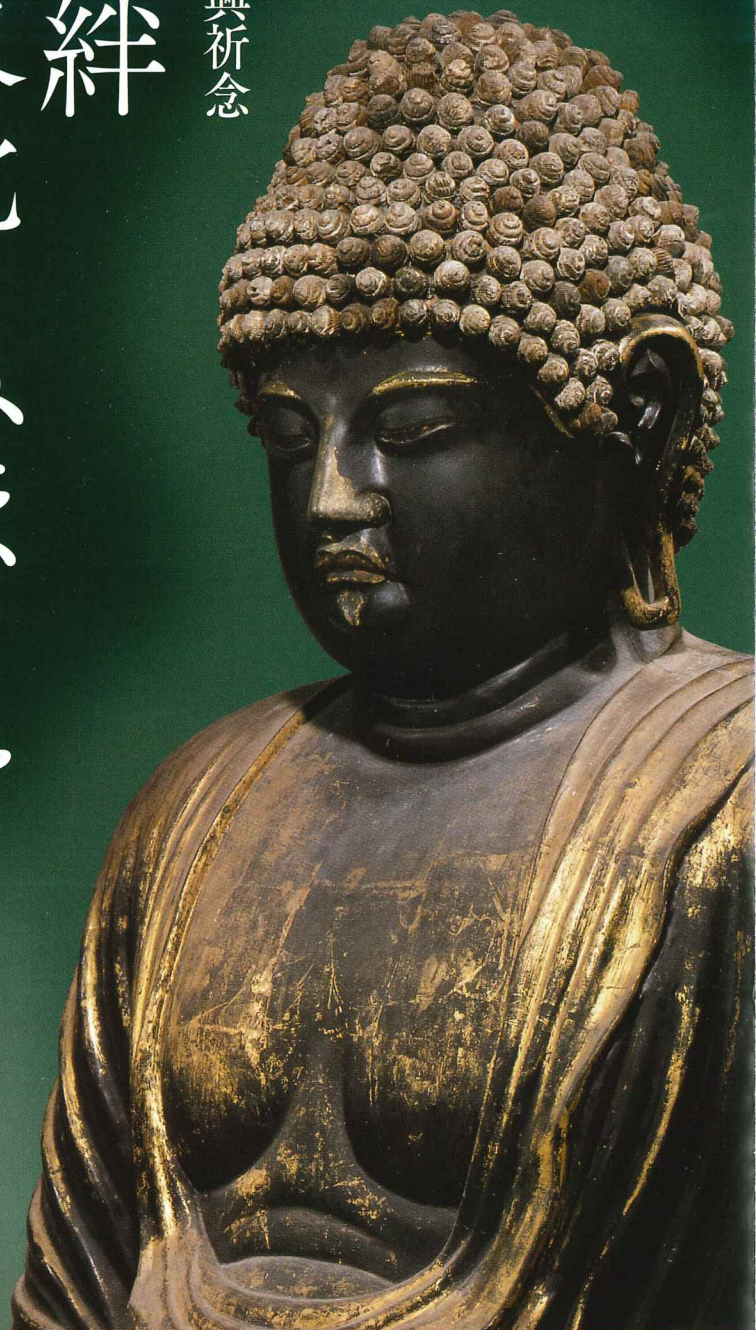
鑑真和上座像(国宝)／奈良県・唐招提寺 [5月21日(日)までの展示]