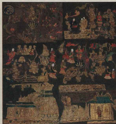
天寿国繡帳（国宝）／奈良県・中宮寺

鈴木空如筆 昭和十一（一九三〇）年 ※5月14日（日）までの展示 5月16日（火）からは第10号壁楽師浄土園へ展示替え