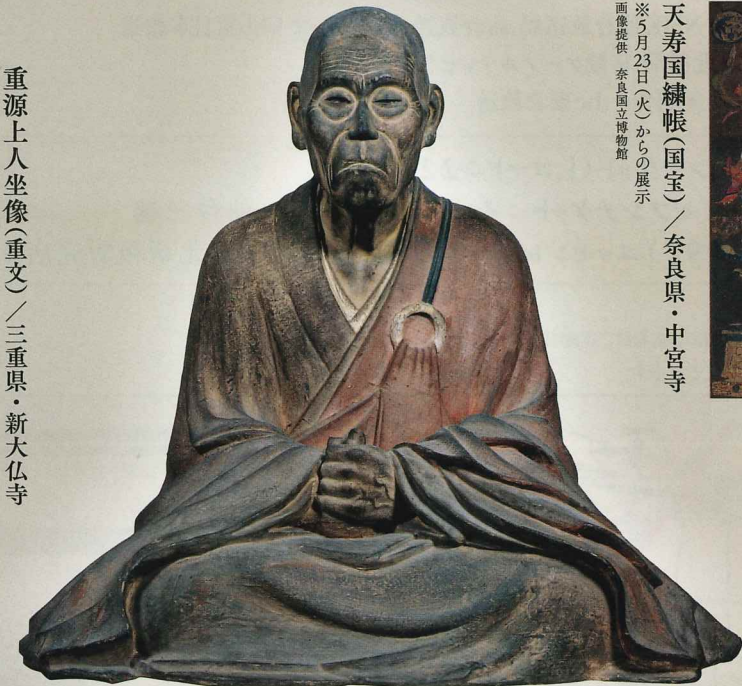
重源上人坐像（重文）／三重県・新大仏寺