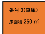
申請を行う畜舎等のイメージ