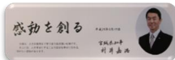
平成30年度 村井知事メッセージカード