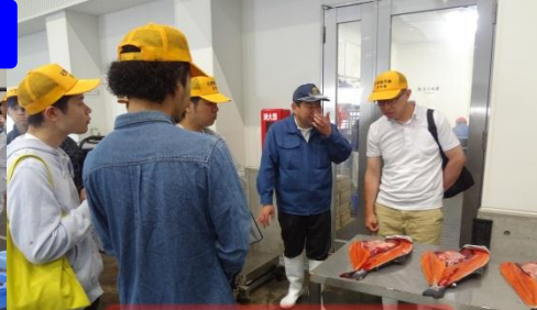
養殖場別のギンザケ見本について質問が多かったです。