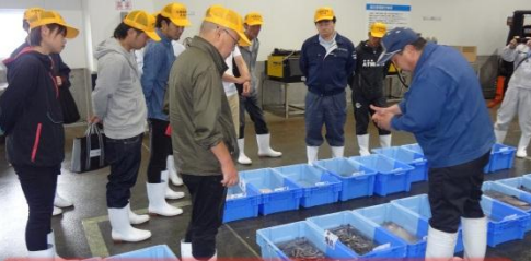
底曳き網で漁獲された魚についての説明