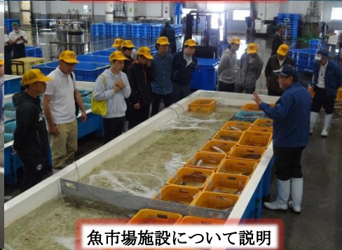
魚市場施設について説明