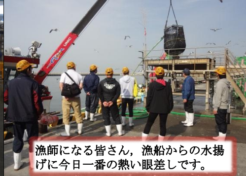
漁師になる皆さん、漁船からの水揚げに今日一番の熱い眼差しです。