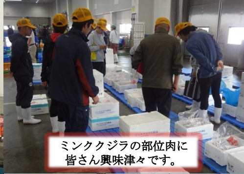
ミンクジラの部位肉に皆さん興味津々です。