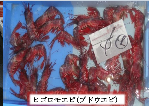
ヒゴロモエビ(ブドウエビ)