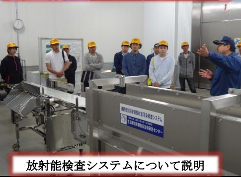
放射能検査システムについて説明