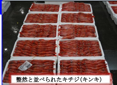
整然と並べられたキチジ(キンキ)

「キチジ」は約2ト水揚げされました。「キチジ」は船上で大きさを揃えて箱詰めされます。一箱の値段は約6,000円～20,000円です。