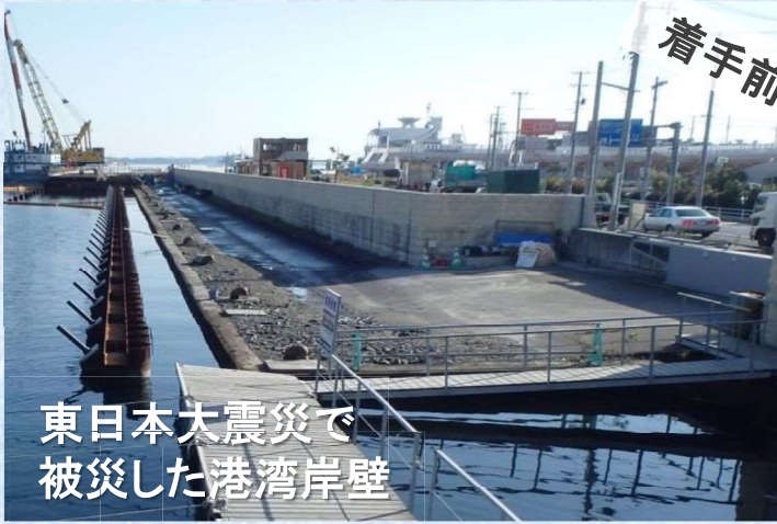
東日本大震災で 被災した港湾岸壁