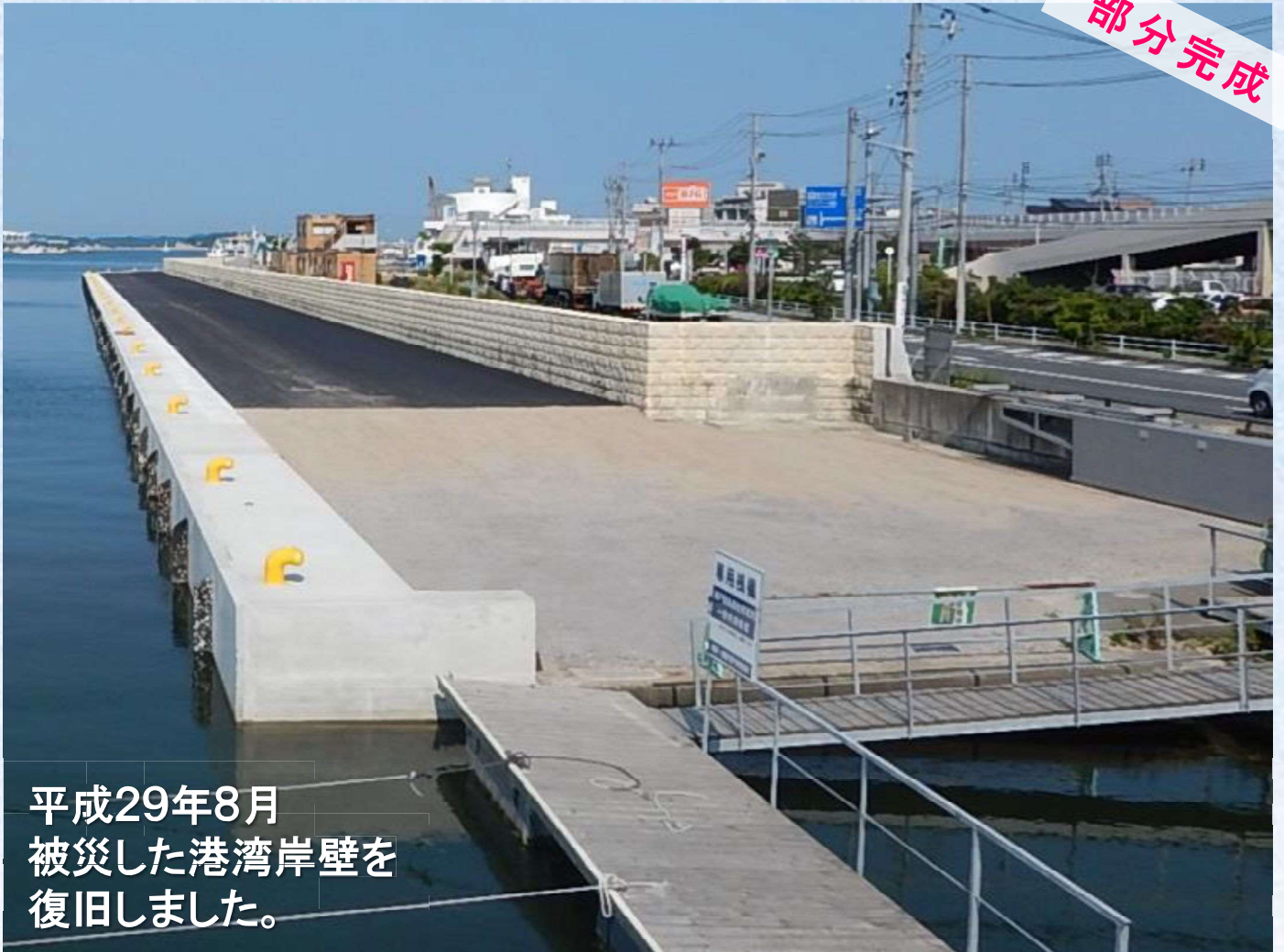
平成29年8月 被災した港湾岸壁を 復旧しました。