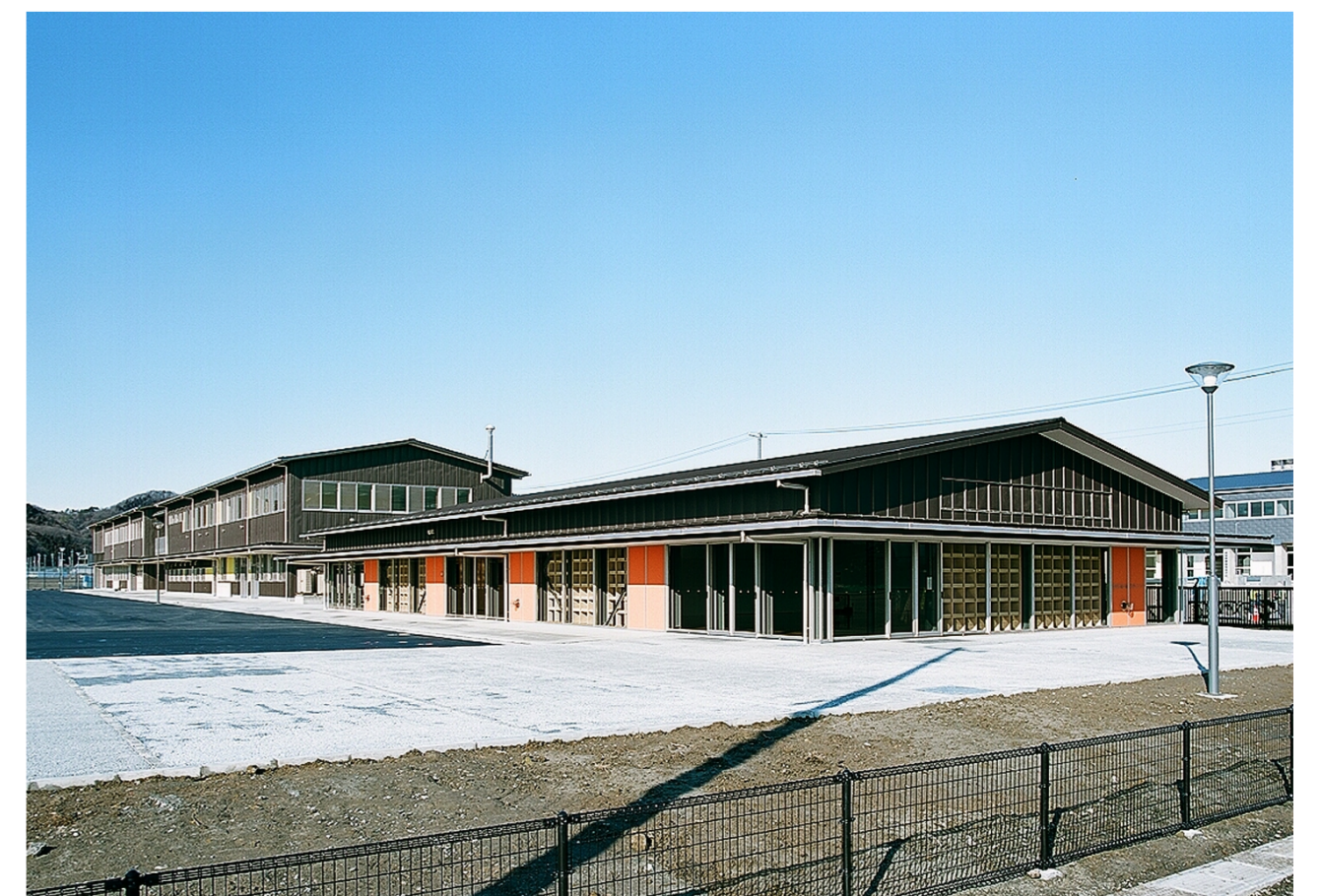
[半屋外スペースを設けた 6次産業化ゾーン]