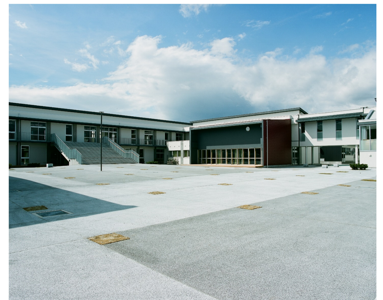
[憩いの場となるセンタープラザ]