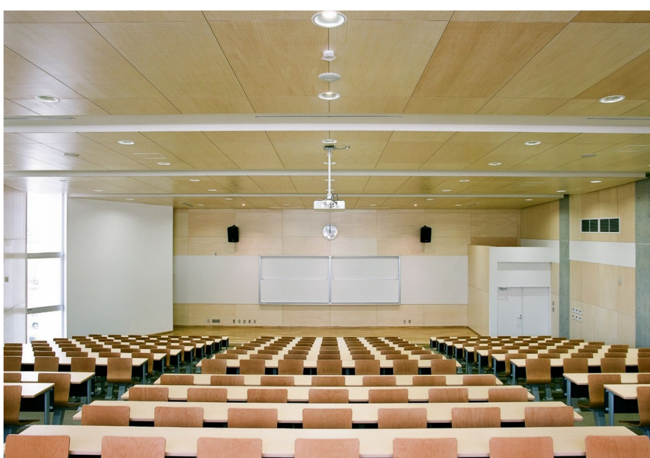
[自然光を取り入れた大講義室]