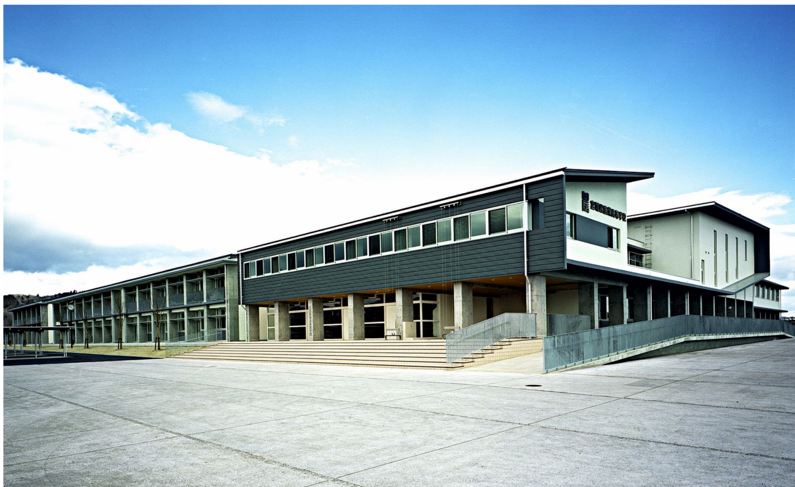
[動線を配慮し低層とした校舎棟]