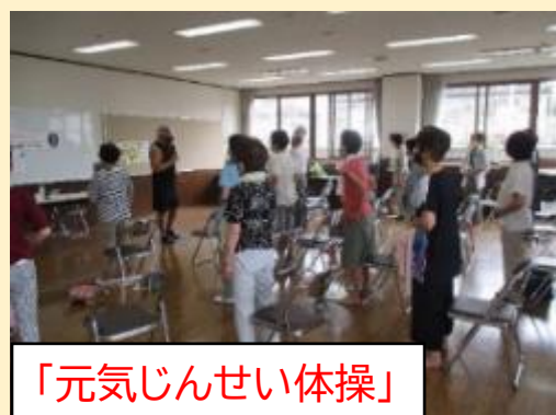
「元気じんせい体操」