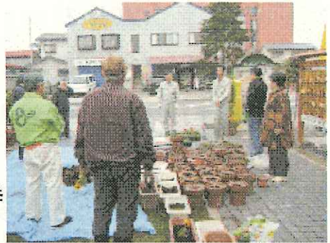
安全作業についての話を聞くサポーター