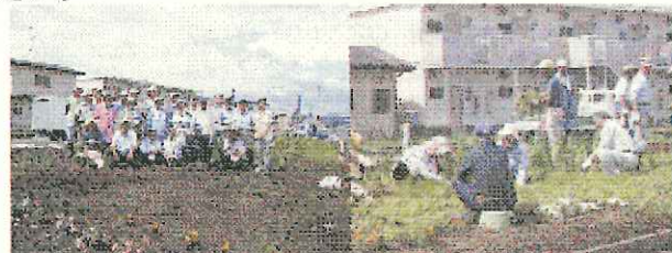
百寿会クリーン・メーカーズの皆さん