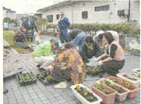
300本のパンジーをプランター等に植栽