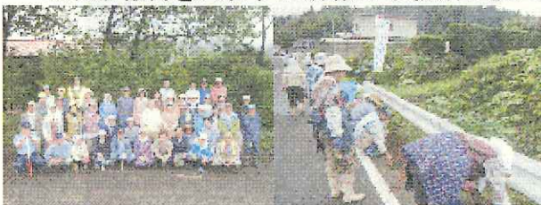
越河第9区自治会の皆さん

これからも多年にわたり功績のある団体等について、積極的に表彰していきたいと考えておりますので、毎年度の活動報告を忘れずに所轄の事務所に提出してください。