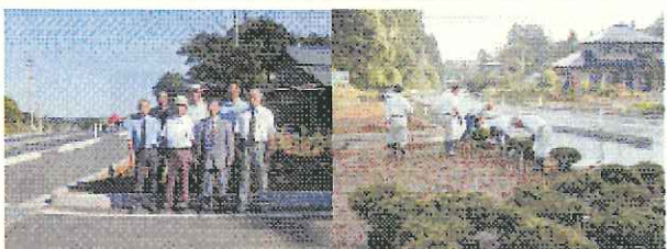
いしこし第二区あじさいクラブの皆さん