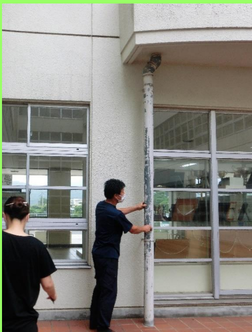
↑保護者による安全点検の様子

同校の校長は、「教員による安全点検は毎月1回行い、危険箇所については町教委にも迅速に対応してもらっているが、今回、保護者の目線での指摘に新たな気付きをいただき感謝している。これを今後の学校安全に生かしていくことが学校の責務であると感じている。この結果は早速、職員会議で共有しており、再度教職員の目で確認した上で、町教委とも連携し、子どもたちが安全・安心な学校生活が送れるように、修繕や廃棄すべきものの処理などを適切に行っていきたい」と話している。