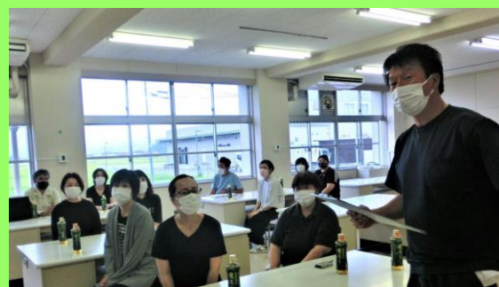
↑点検実施後には、点検結果を共有