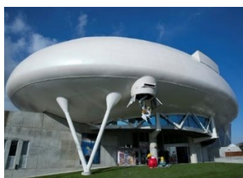
石ノ森萬画館（石巻市）