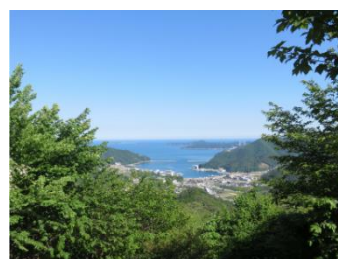
黒森山からの眺望（女川町）