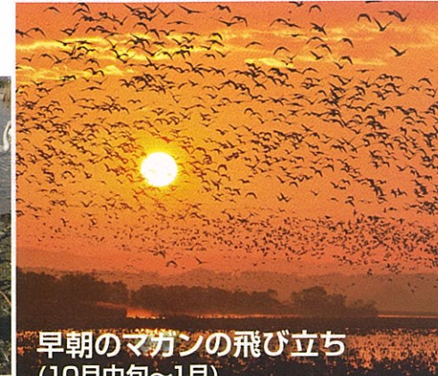
早朝のマガンの飛び立ち (10月中旬~1月)