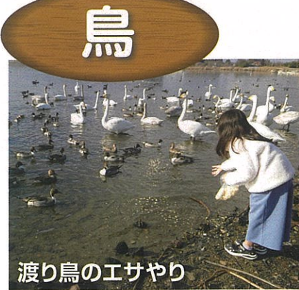
渡り鳥のエサやり