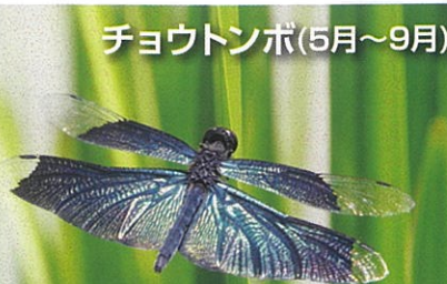
チョウトンボ(5月~9月)