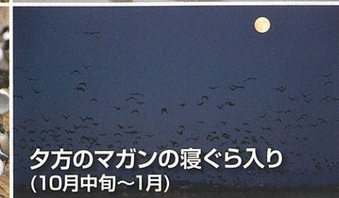
夕方のマガンの寝ぐら入り (10月中旬~1月)