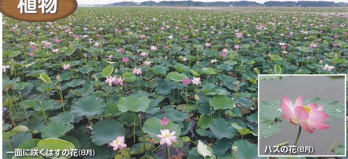
一面に咲くはすの花(8月)