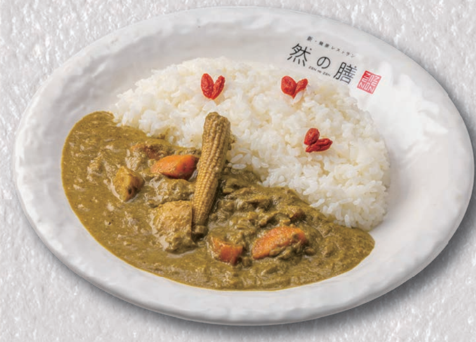
薬膳ほうれん草カレー