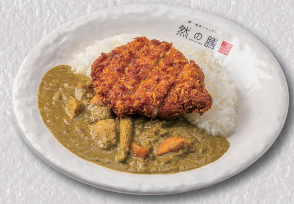
薬膳ほうれん草 カツカレー