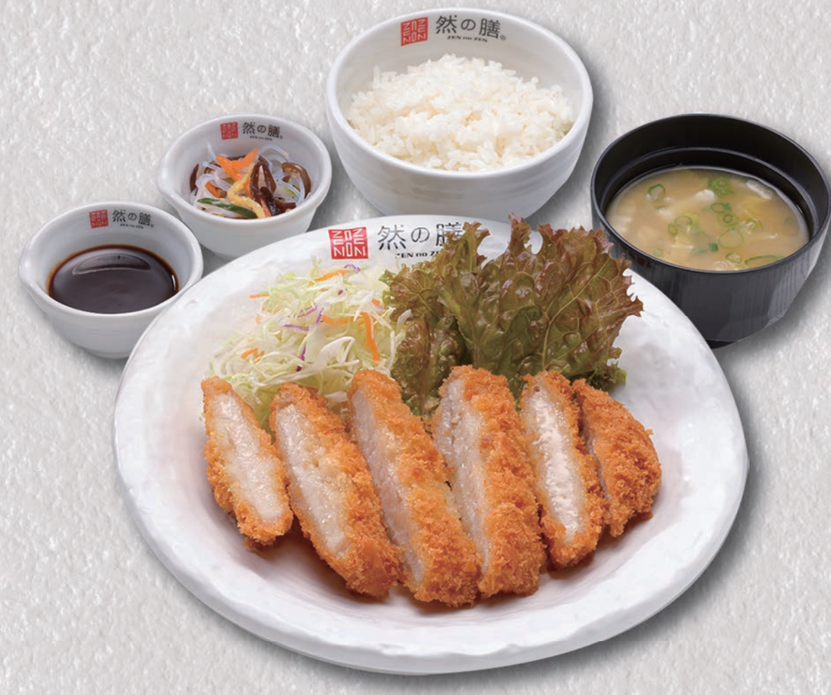
薬膳ソースのとんかつ定食