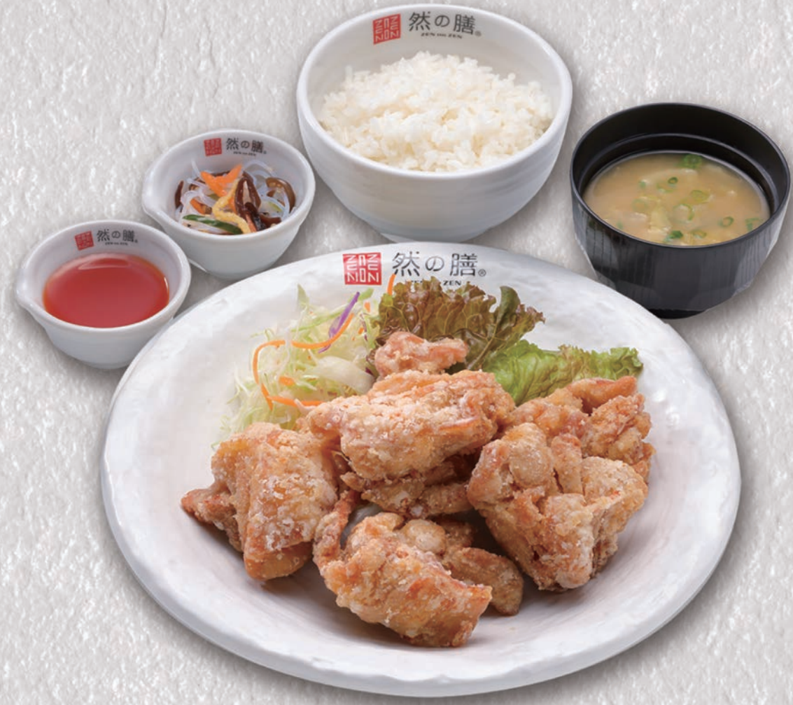
自家製薬膳タレ漬け唐揚げ定食