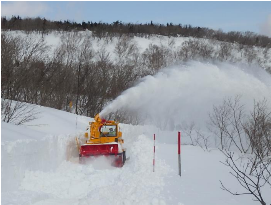
3月8日 澄川ゲート付近