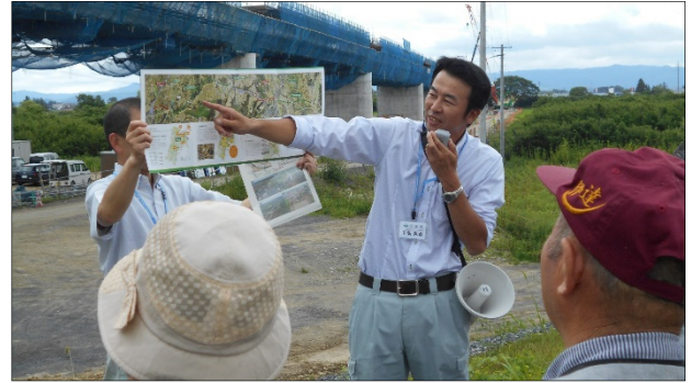
職員による事業概要説明