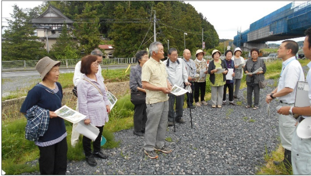
砥落老人クラブの方々

砥落老人クラブの方々が、みやぎ県北道路の工事現場を見学に来られました。 当日は、道路建設第二班の職員が、県北道路の事業概要や現在の工事進捗状況を説明したうえ、紫雲山大橋の工事状況を見学していただきました。 地元有志の方々にて見学会に参加されたことから、県北道路への関心の高さが伺えました。 早期開通を目指し、鋭意工事を進めてまいりますので、引き続き御理解、御協力のほどよろしくお願い申し上げます。