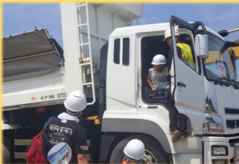
重機試乗体験(ダンプトラック)