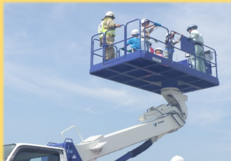
重機試乗体験(高所作業車)