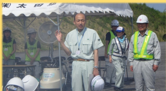
開会の挨拶(東部土木事務所登米地域事務所長)