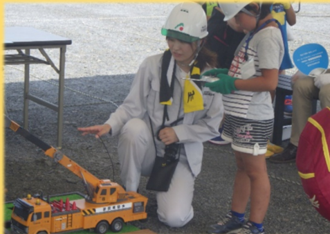
重機ラジコン体験