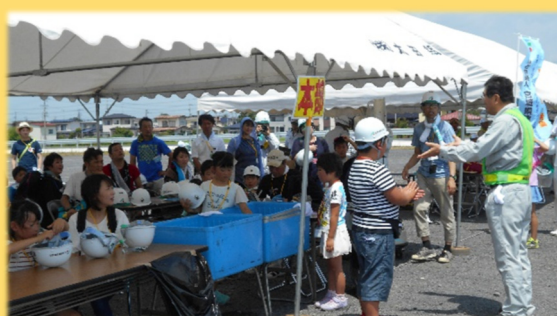
挨拶(宮城県建設業協会 猪股登米支部長)