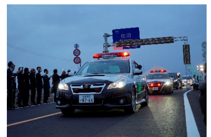
〈開通パレードの様子〉

お問い合わせはこちらまで 宮城県東部土木事務所登米地域事務所 道路建設第二班 〒987-0511 宮城県登米市迫町佐沼字西佐沼150-5 電話：0220-22-5115 E-mail：et-tmdbkk2@pref.miyagi.jp