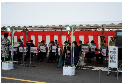
〈中田中学校吹奏楽部の演奏〉