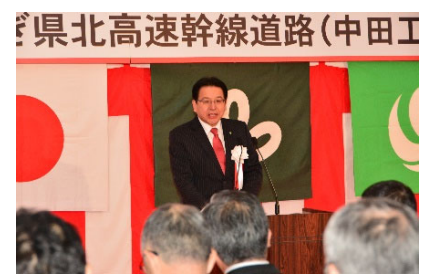
〈栗原市長 千葉健司〉