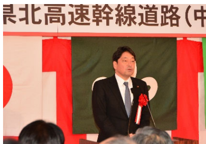
〈衆議院議員 小野寺五典 さま〉