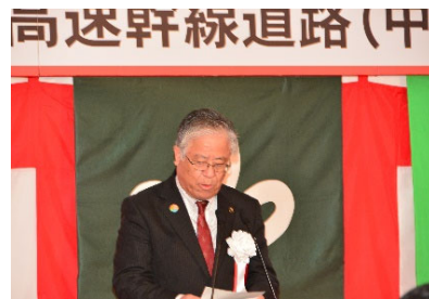
〈登米市長 熊谷盛廣〉