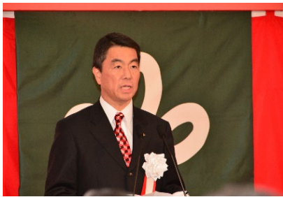
〈宮城県知事 村井嘉浩〉