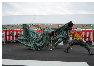
〈長谷観世音虎舞保存会による虎舞披露〉