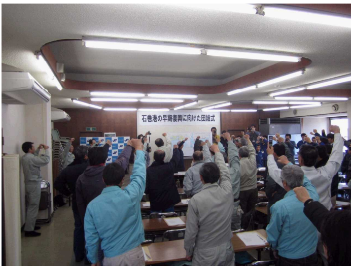
●浅野石巻商工会議所会頭による団結宣言

4月1日(金)、石巻商工会議所において『石巻港の早期復興に向けた団結式』（主催：宮城県・石巻市・東松島市・石巻商工会議所・石巻港整備利用促進期成同盟会・石巻港企業連絡協議会）を開催し、石巻港の早期復旧に向けて団結式及び決議をしました。