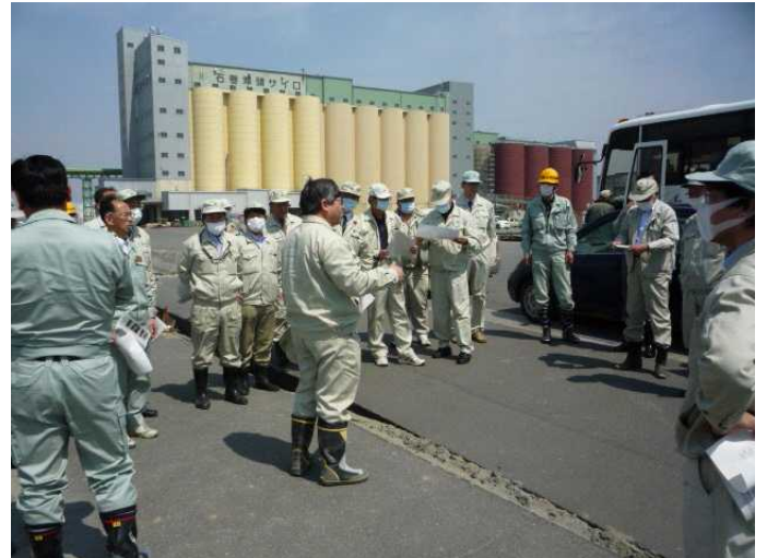
●4月15日宮城県議会による現地調査

4月15日、宮城県議会の大震災対策調査特別委員会の県議会議員23名が、石巻港の被害状況を調査しました。