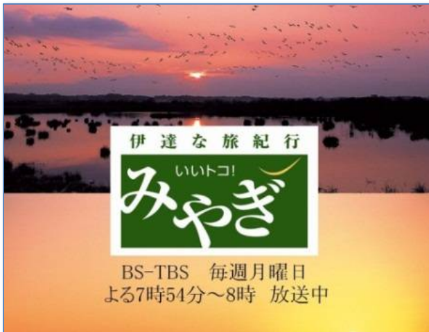
(広告画像のイメージ)