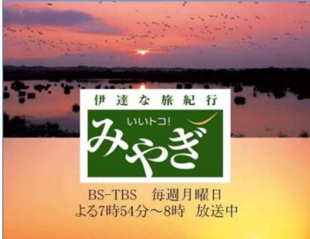
(広告画像のイメージ)