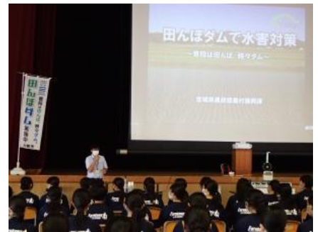
▲県職員による説明の様子

授業を終え、生徒からは「田んぼダムの有無によって、水の流れる勢いに大きな違いが出ていて驚いた。」「田んぼダムのような少しの工夫で災害防止につながる事が分かった。」などという感想がありました。