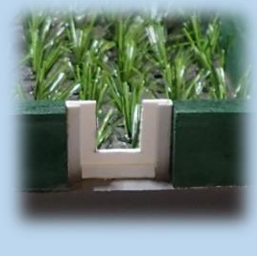
▲田んぼダムと通常の田んぼを再現した模型