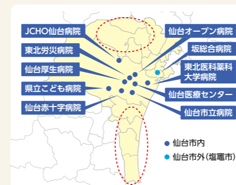
図1 仙台医療圏の地域医療支援病院(※2) ※2 かかりつけ医との連携などにより、地域医療の確保を図る病院