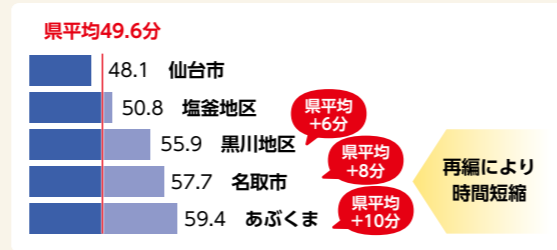
図4 各消防本部(局)の搬送時間(分) (令和4年)

また、回復期病床の不足など、病院再編だけでは解決できない課題についても、市町村や医療機関と連携しながら取り組んでいきます。