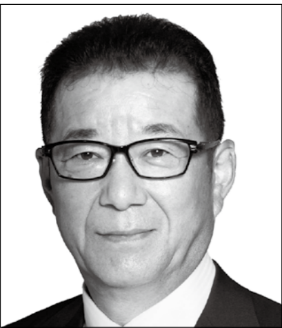
代表 松井 一郎