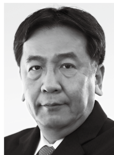
立憲民主党 代表 枝野幸男