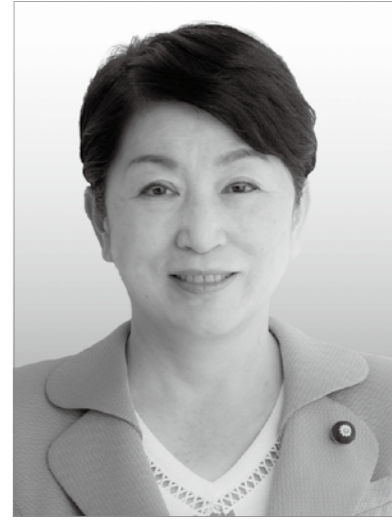
社民党党首 福島みずほ