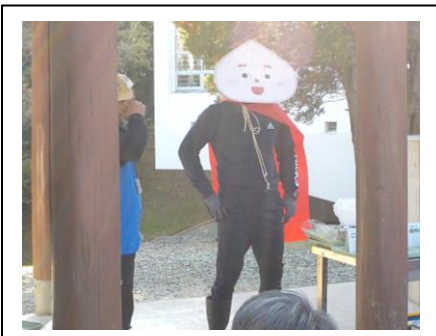
「おやつまん」登場! 牡蠣とホヤとわかめが入った海鮮おやつまん作り