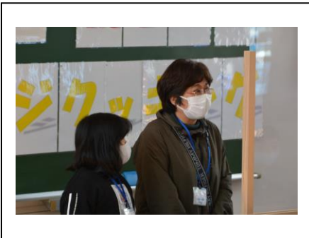
開講式 参加者代表挨拶