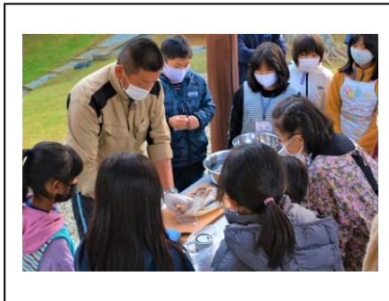
勇気を出して、イカの胴抜きチャレンジ!