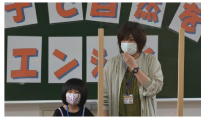
閉講式（代表者挨拶）