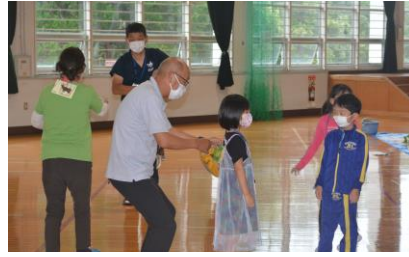
講師の先生と一緒にゲーム