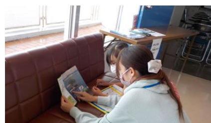
館内なぞときラリー