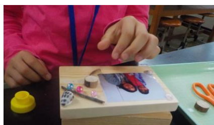
ネイチャーアート（フォトフレーム）