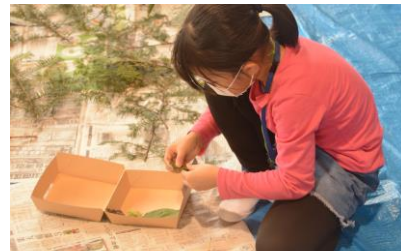
木の実や小枝等を使って弁当箱に入れていきました。