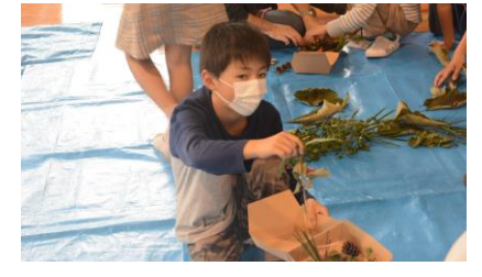
弁当箱の中身はこれにしよう！