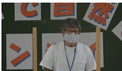
開講式（参加者代表挨拶）