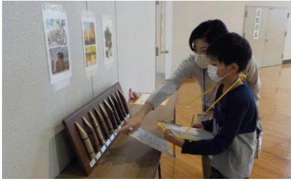
館内なぞときラリー