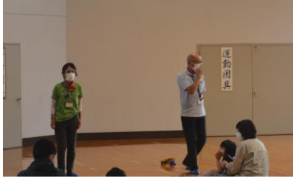
講師の先生からのお話