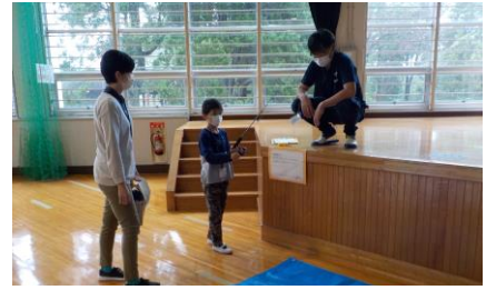
館内なぞときラリー (魚釣りにチャレンジ)