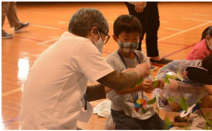
弁当箱の中身の彩りを考えながら・・・