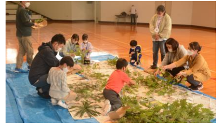
自然の森弁当作りにチャレンジ