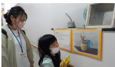
館内なぞときラリー