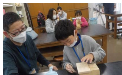
ネイチャーアート（フォトフレーム）