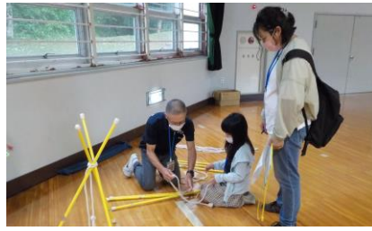
館内なぞときラリー (ロープワークにチャレンジ)