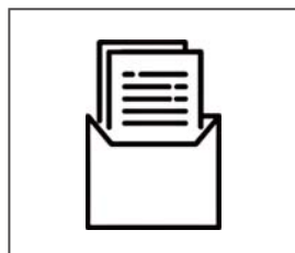
応募書類の作り方