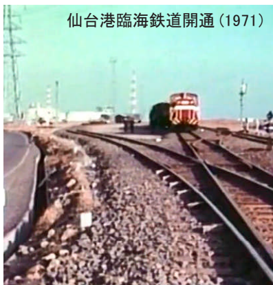
仙台港臨海鉄道開通 (1971)