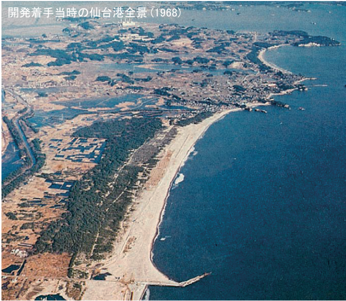
開発着手当時の仙台港全景(1968)