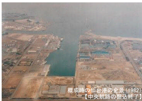
概成時の仙台港の全景 (1982) 【中央航路の掘込終了】