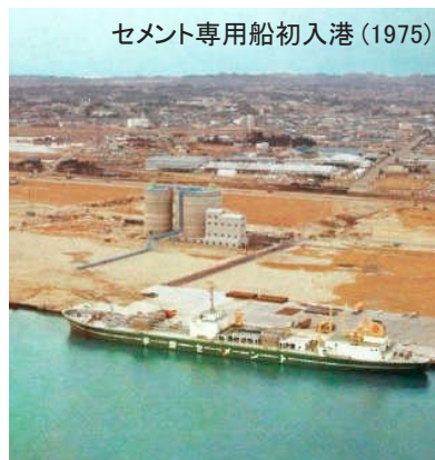
セメント専用船初入港 (1975)