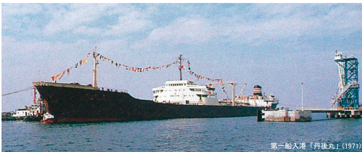
第一船入港「丹後丸」(1971)