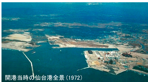
開港当時の仙台港全景 (1972)