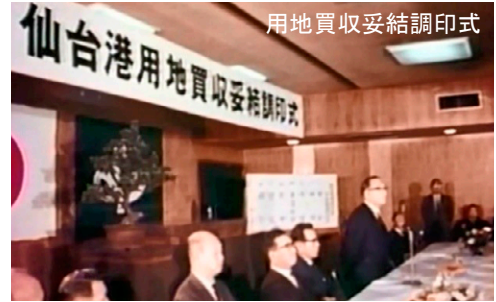
用地買収完了調印式