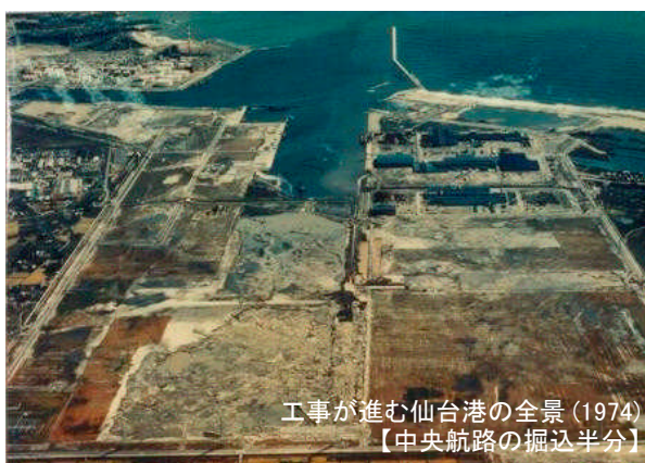
工事が進む仙台港の全景 (1974) 【中央航路の掘込半分】