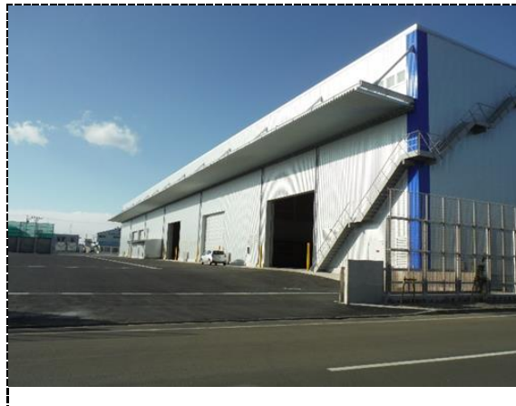
全景・外観（低炭素型リサイクル工場棟）