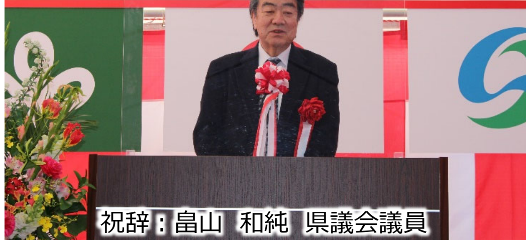
祝辞：畠山 和純 県議会議員