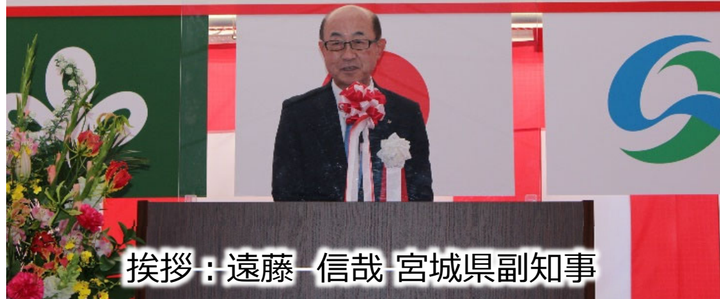
挨拶：遠藤 信哉 宮城県副知事