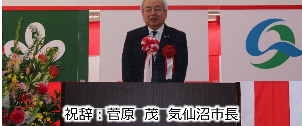
祝辞：菅原 茂 気仙沼市長