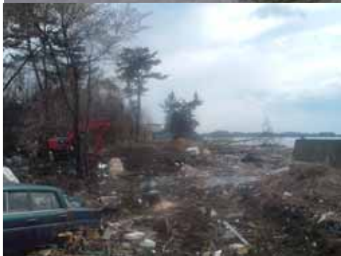
長石海岸堤防決壊