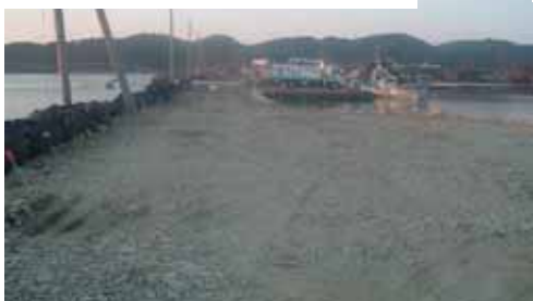
長浜海岸応急仮締切完了