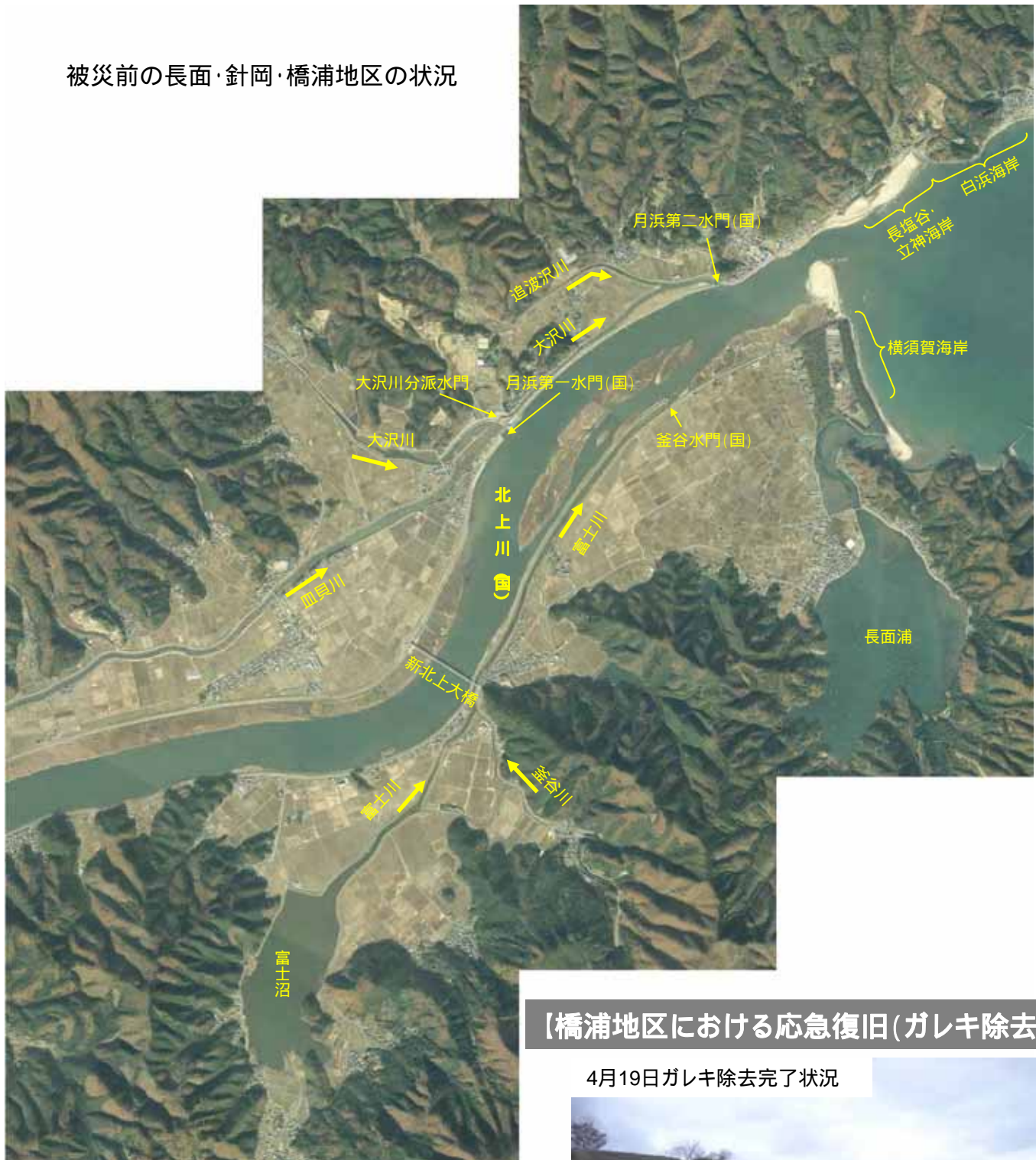
被災前の長面・針岡・橋浦地区の状況