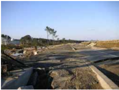
州崎海岸堤防裏法損壊