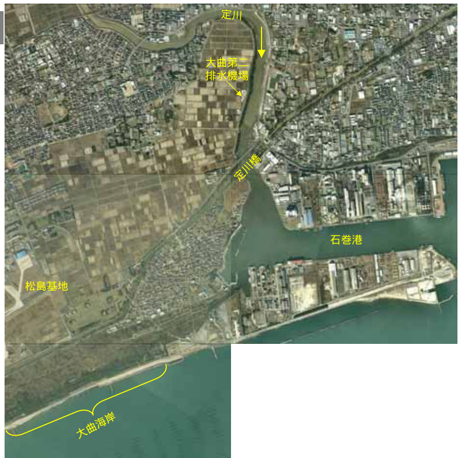
被災前の大曲地区の状況