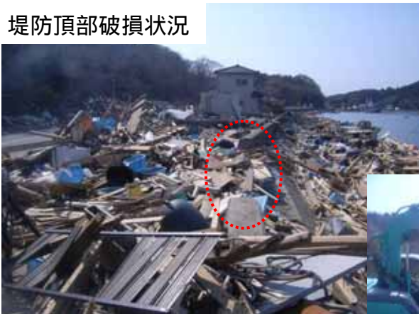
堤防頂部破損状況