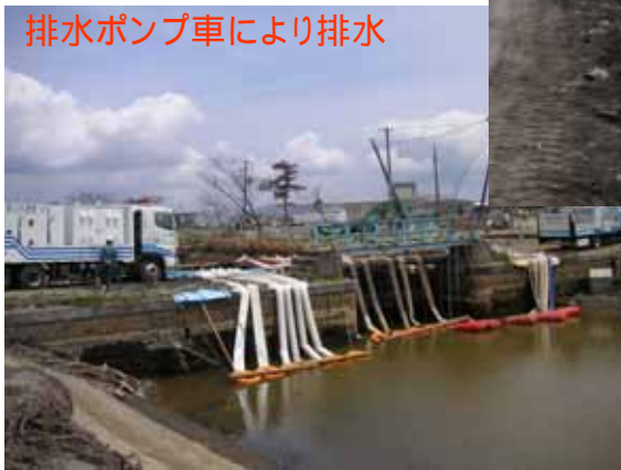
排水ポンプ車により排水