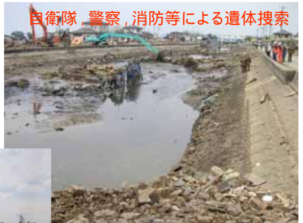
自衛隊, 警察, 消防等による遺体捜索