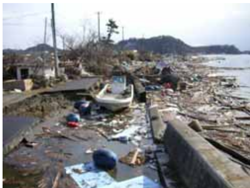
長浜海岸堤防決壊