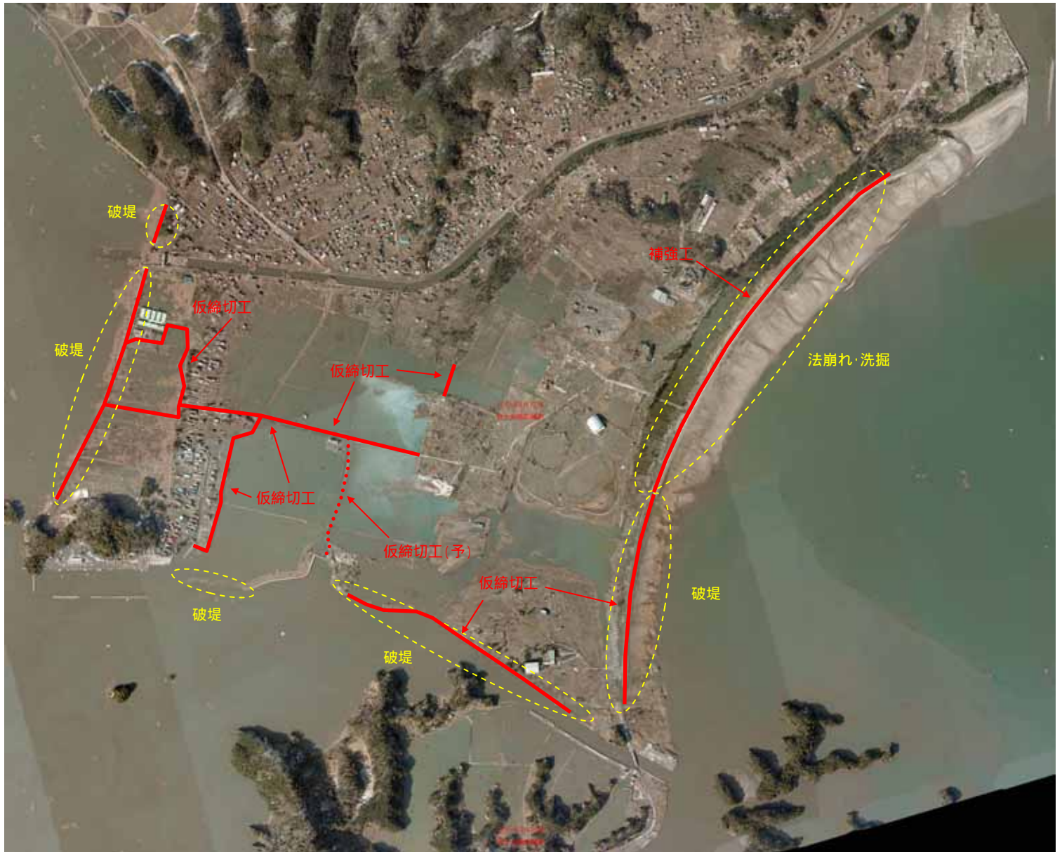
野蒜地区の被災後の浸水状況(3月12日) 国土地理院資料