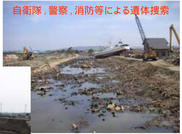
自衛隊, 警察, 消防等による遺体捜索