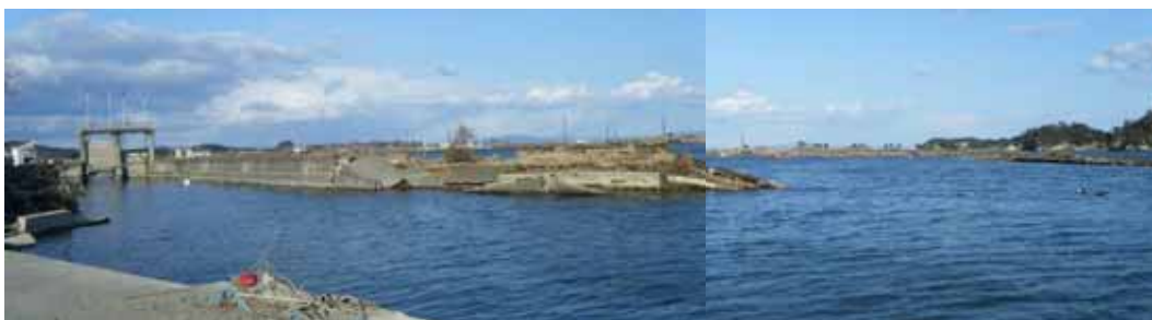
東名海岸被災状況