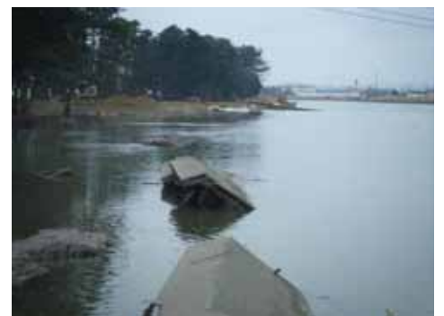
大曲第二排水機場から 上流の被災状況