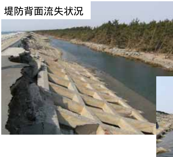
堤防背面流失状況