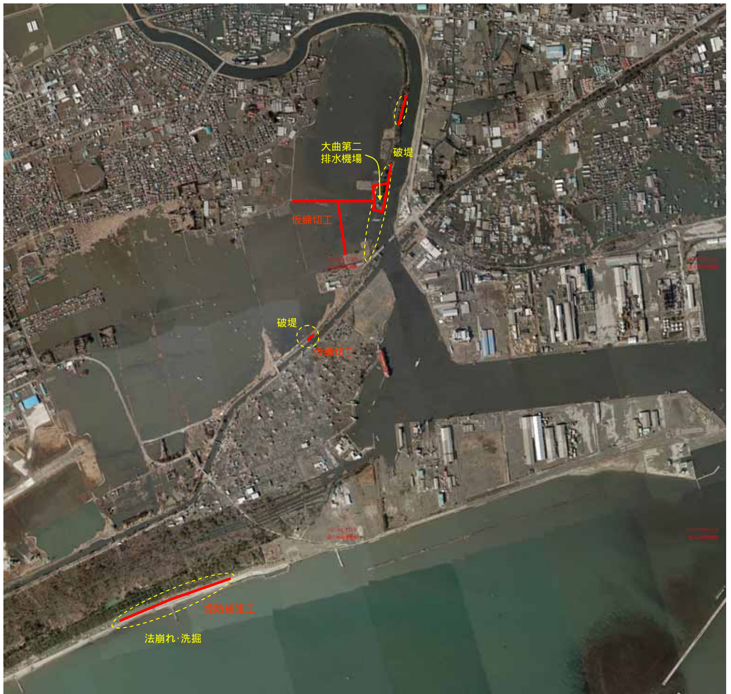
大曲地区の被災後の浸水状況(3月12日)