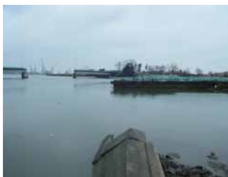
大曲第二排水機場から 下流の被災状況