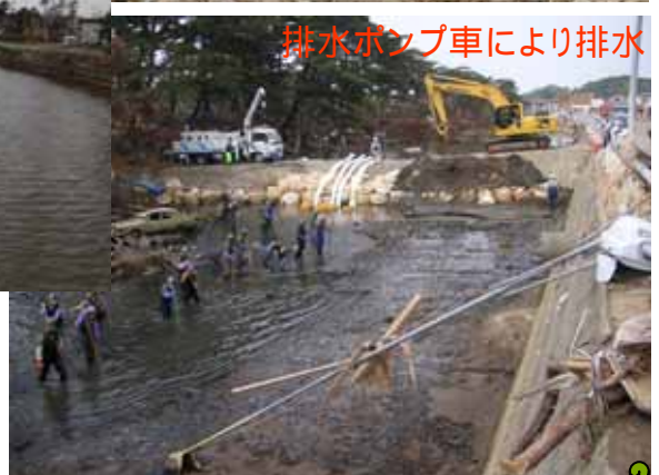
排水ポンプ車により排水