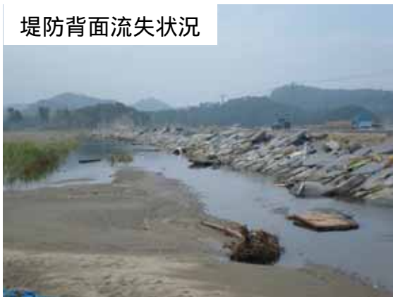
堤防背面流失状況