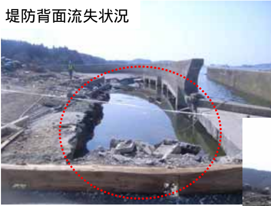
堤防背面流失状況