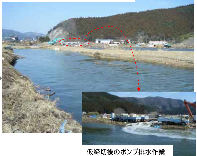
仮締切後のポンプ排水作業