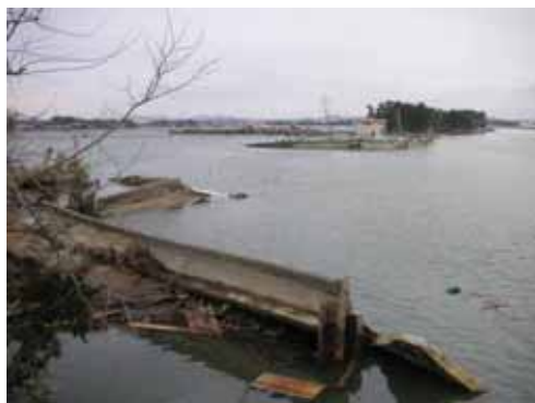
定川右岸堤防の決壊