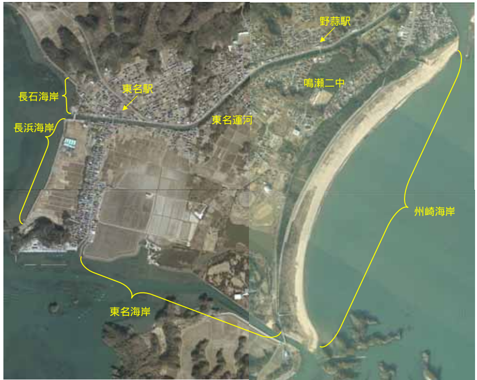
被災前の野蒜地区の状況