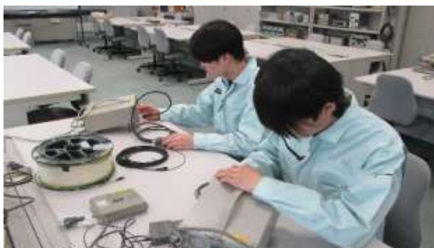
情報通信ネットワーク科

修了生アンケートでは、多くの修了生から「高技専に入ってよかった」と回答がありました。