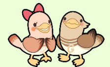
宮城県がん征圧イメージキャラクター がん助くん・グーチちゃん