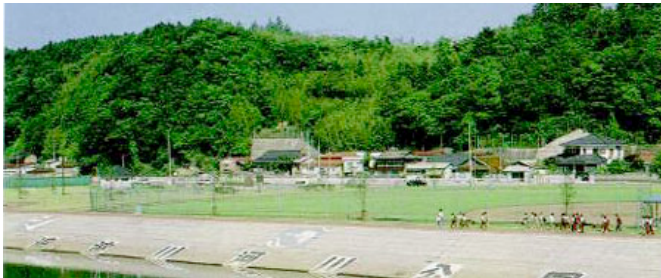
▲追波川河川運動公園