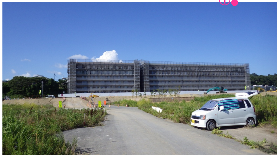
①整備が進む南光湊線(高盛道路)と復興公営住宅