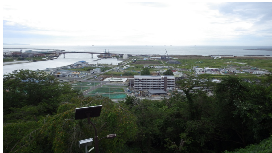
②日光山から見た宅地や復興公営住宅の整備状況