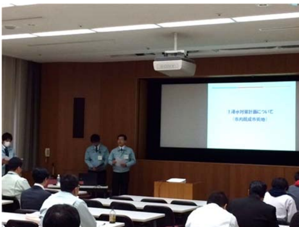
市町村の浸水対策の取組状況