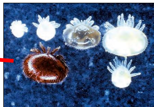
ミツバチヘギイタダニ