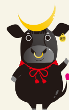
仙台牛PRキャラクター うし まさ むね 牛政宗くん