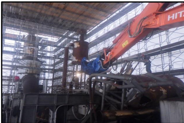
写真: 燃焼室を解体しています

2月から焼却施設の解体と地下燃焼室の一時的な埋戻し作業を開始しました。3月からは、焼却施設の足場解体と煙突部分の足場組立作業を行いその後、煙突部洗浄作業を予定しております。