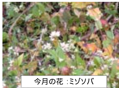
今月の花:ミソソバ