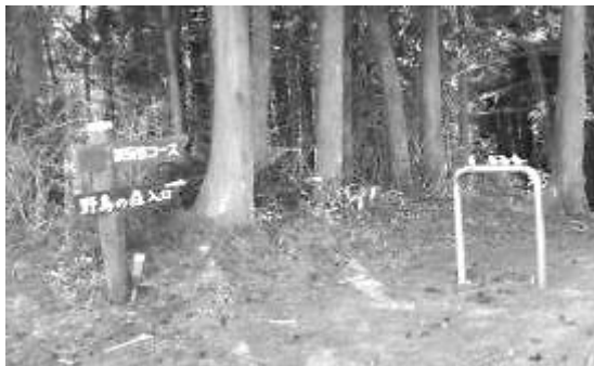
野鳥の森入口付近