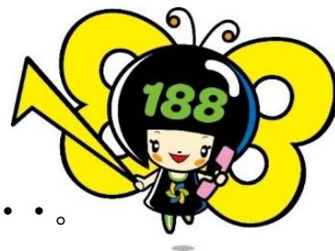
消費者庁 消費者ホットライン 188イメージキャラクター 「いやヤン」

そんなときは、全国どこからでも3桁の電話番号でつながる消費者ホットライン「188(いやや!)」にご相談ください。専門の相談員がトラブル解決を支援します。