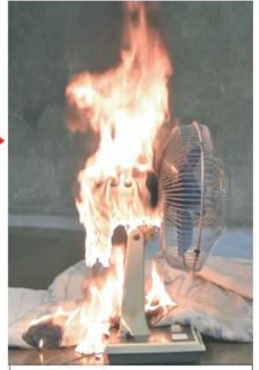
炎で溶けた樹脂が布団に落ち燃え広がりました 【NITEの再現実験】